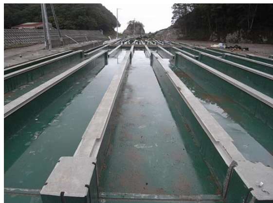
写真 4 重茂漁協のサケ孵化・飼育施設 (2011年8月19日)

白い建物は海底取水システムの逆洗用高架水槽を収容したポンプハウス。手前は巡流水槽を固定していたコンクリート架台。