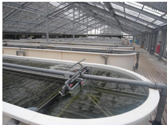
写真 2 重茂漁協アワビ種苗生産施設 ソーラーハウス内に並ぶ巡流水槽群 (2010年2月11日)