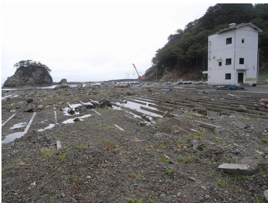
写真 3 被災した重茂漁協アワビ種苗生産施設 (2011年8月19日)

白い建物は海底取水システムの逆洗用高架水槽を収容したポンプハウス。手前は巡流水槽を固定していたコンクリート架台。